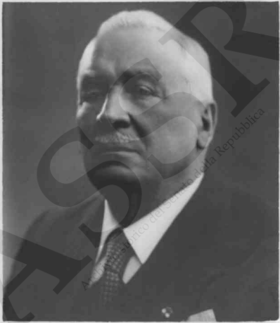
Ambasciatore del Senato della Repubblica